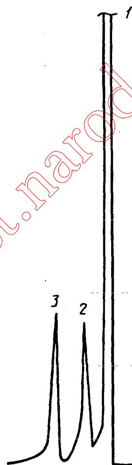
1 — растворитель; 2 — антиоксидант ВС-30А; 3 — эйкозан («внутренний эталон»)

Типовая хроматограмма определения антиоксиданта ВС-30А в латексе